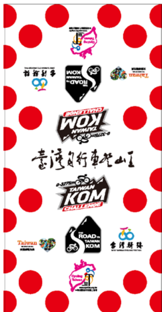
[ 樣式設計圖 ]