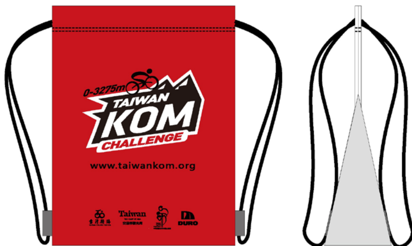
[ 樣式設計圖 ]